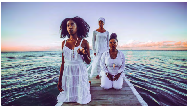
Imagem do projeto "Náu Frágil" da artista residente Val Souza (Performance / Brasil 2018) no qual colaboraram as residentes Victoria Adukwei Bulley (Literatura / Reino Unido 2018) e amara tabor-smith (Performance / EUA 2018).